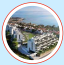
8. Vitta Marina