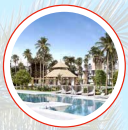
1. Ayana Estepona